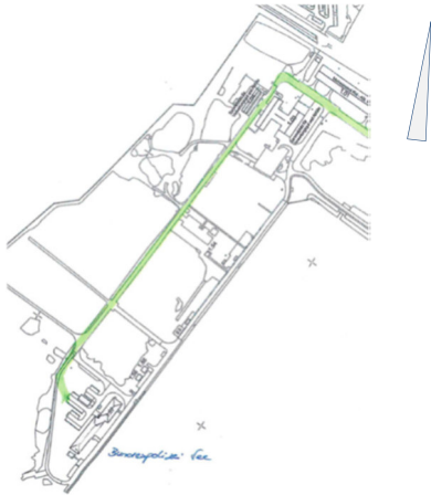
BPo im MSTP Hohe Düne Westkaje

Standort Schiffspropeller Fundament 3,50 x 3,50 m